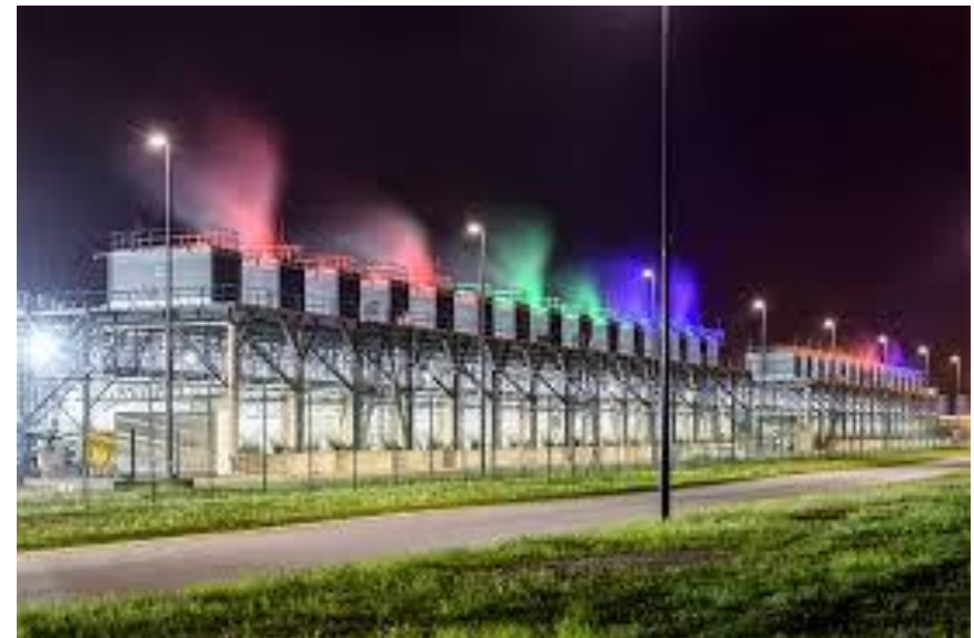
Centro de dados da Google!